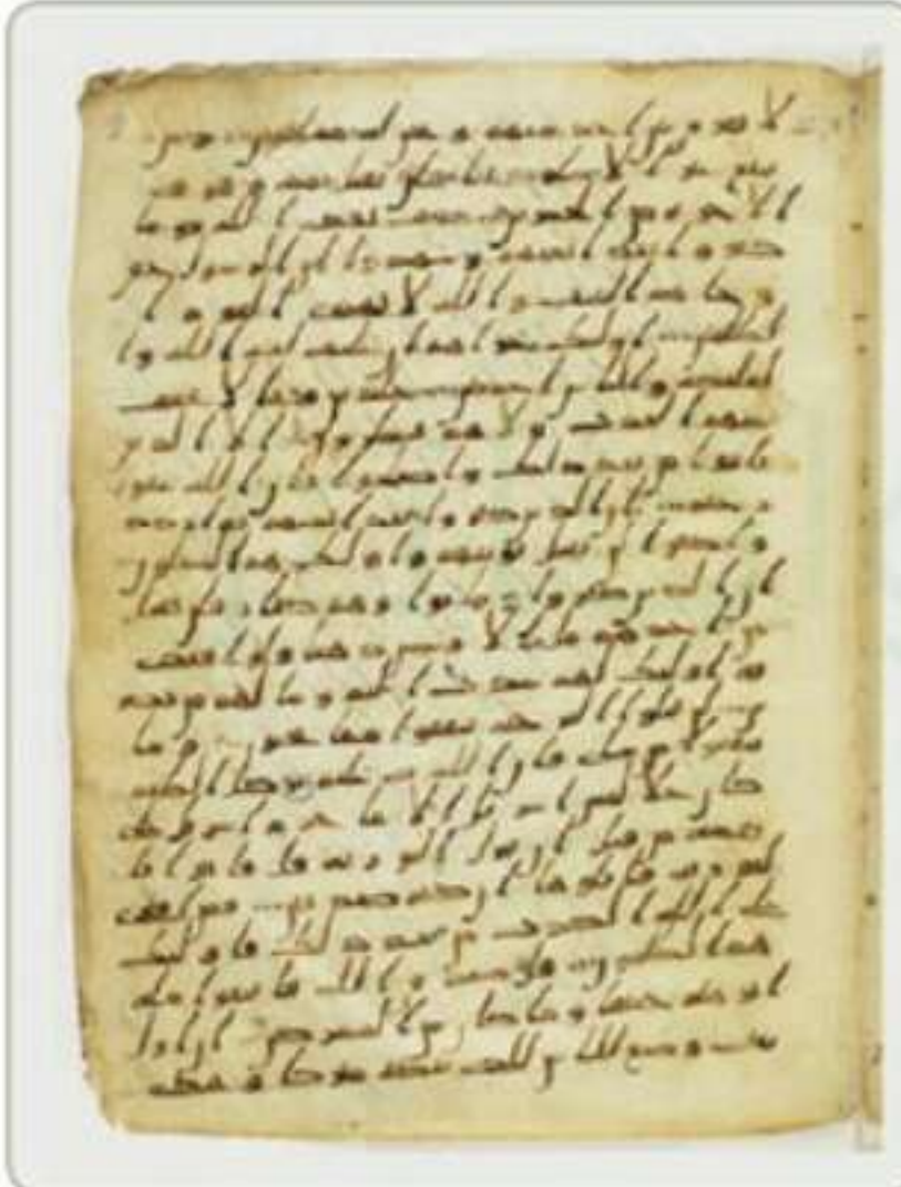
مصحف مكتوب في القرن الأول الهجري بالخط المدني ومحفوظ في مكتبة باريس