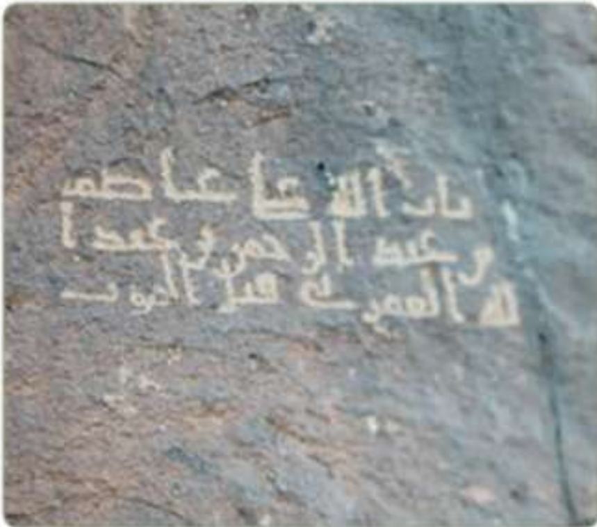
نقش الخطل المدني على سفوح جبال المدينة المنورة

كما أسفرت الكشوف الأثرية عن موقع قديم جداً في منطقة الرياض بين تثليث ووادي الدواسر، وهو موقع (المقر) الذي وجدت فيه شواهد على حضارة يصل عمرها إلى نحو تسعة آلاف سنة، وعلى أقدم استئناس للخيل في العالم.