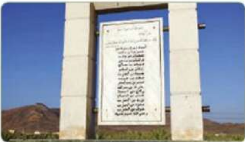
موقع غزوة بدر الكبرى

هو الموضع الذي دارت فيه أحداث غزوة بدر الكبرى في السنة الثانية من الهجرة بين النبي محمد ﷺ وقريش. وهو على مسافة ١٥٠ كم غرب المدينة المنورة.