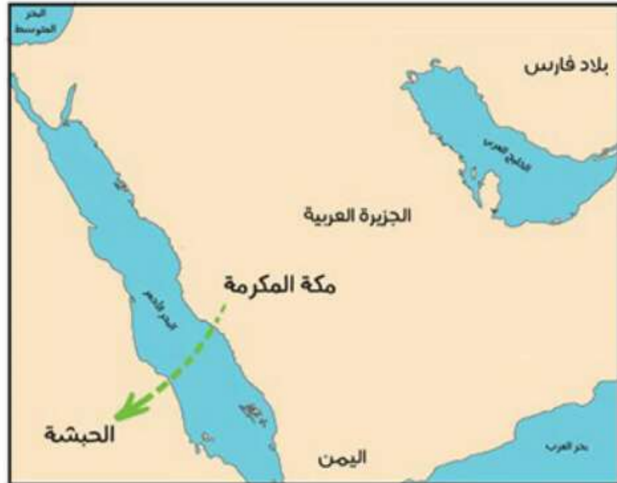
الهجرة إلى الحبشة

تشكل الحبشة قديماً أغلب إثيوبيا حالياً، وتقع شرق القارة الإفريقية، وكان فيها مملكة أكسوم التي استمرت مدة زمنية طويلة.