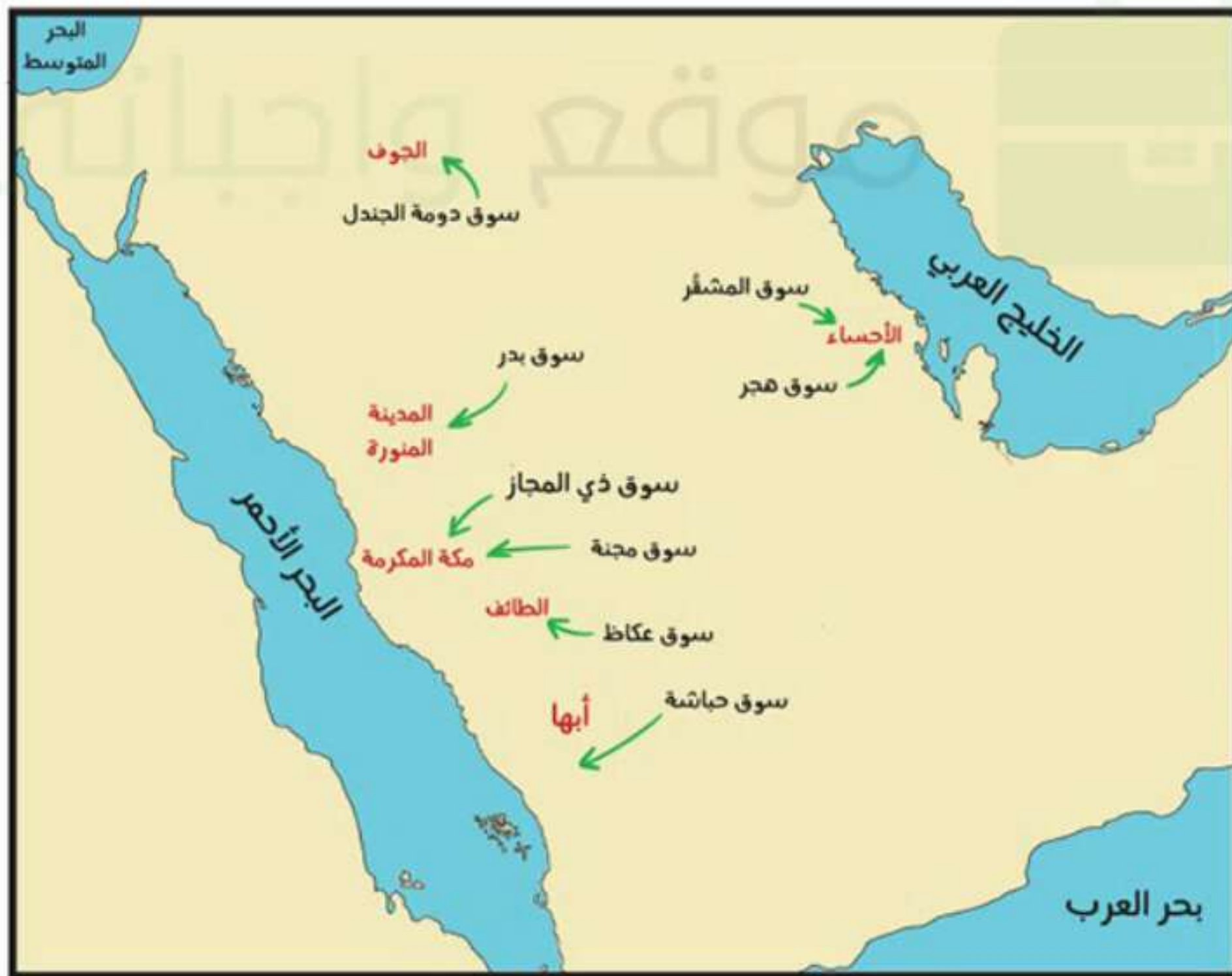
أبرز مواقع أسواق العرب في الجزيرة العربية

وما يميز هذه الأسواق الحضارية لعرب الجزيرة العربية أنها تجذب كثيراً من سكان الشام ومصر والهند والعراق وغيرها. وكانت تلك الأسواق تمثل المكانة الحضارية لعرب الجزيرة العربية ووسيلة اتصال بالشعوب والحضارات الأخرى خارج الجزيرة العربية.