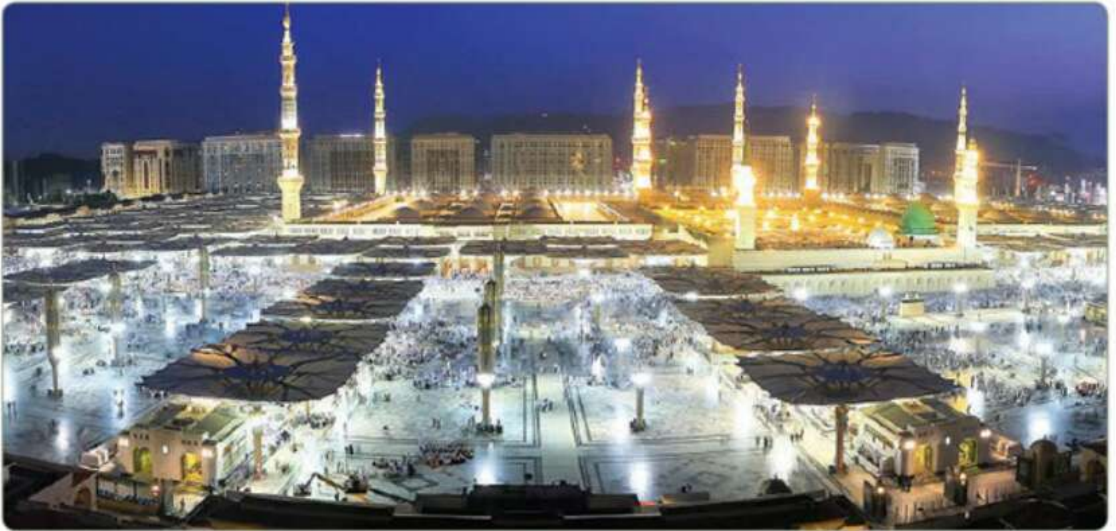
المسجد النبوي بالمدينة المنورة

كان اسم المدينة المنورة قديماً (يثرب)، وكانت تقوم أساساً على الزراعة والرعي، وعندما قدم إليها النبي محمد ﷺ غير اسمها إلى المدينة وطيبة أو طابة. عن جابر بن سمره رضي الله عنه قال: قال رسول الله ﷺ: «إن الله تعالى سمى المدينة طابة» (رواه مسلم). قال الله تعالى: ﴿وَالَّذِينَ تَبَوَّءُوا الدَّارَ وَالْإِيمَانَ مِنْ قَبْلِهِمْ يُحِبُّونَ مَنْ هَاجَرَ إِلَيْهِمْ﴾ (الحشر: ٩). وأورد المؤرخون أسماء أخرى للمدينة المنورة، منها: المطيِّبة، والدار، وجابرة، ومجبورة، ومنيرة.