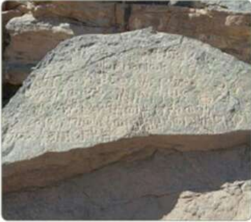
نقش من حمى - نجران

هي المؤلفات التي كتبت باللغتين اليونانية واللاتينية في حقبة قديمة جداً قبل الإسلام، أي من القرن الخامس قبل الميلاد حتى القرن الثالث الميلادي.