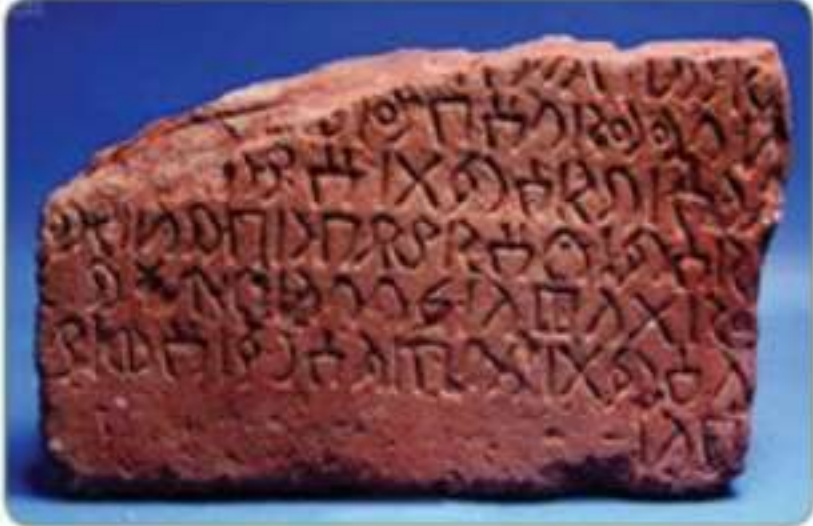
نقش بالخط النبطي