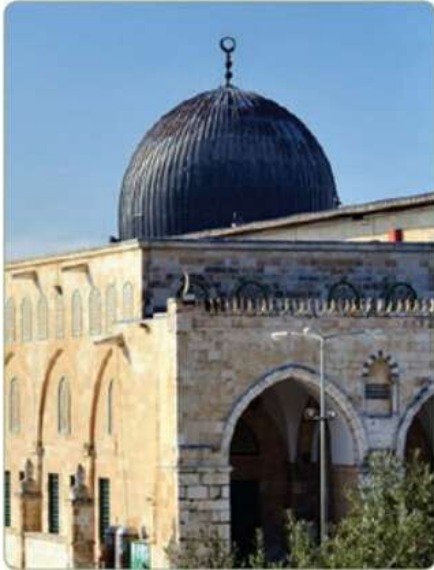
المسجد الأقصى بالقدس

منذ ذلك التاريخ ومكة المكرمة مهبط الوحي قبلة للمسلمين في جميع أنحاء العالم وإلى اليوم، ولهذا تحرص حكومة وطني المملكة العربية السعودية على العناية بالمسجد الحرام والكعبة المشرفة والمسجد النبوي والمشاعر المقدسة، وخدمة الحجاج. وتتشرف المملكة والمواطنون فيها بخدمة الحرمين الشريفين وحمل المسؤولية والشرف بأن الوطن فيه قبلة المسلمين ومثوى النبي ﷺ