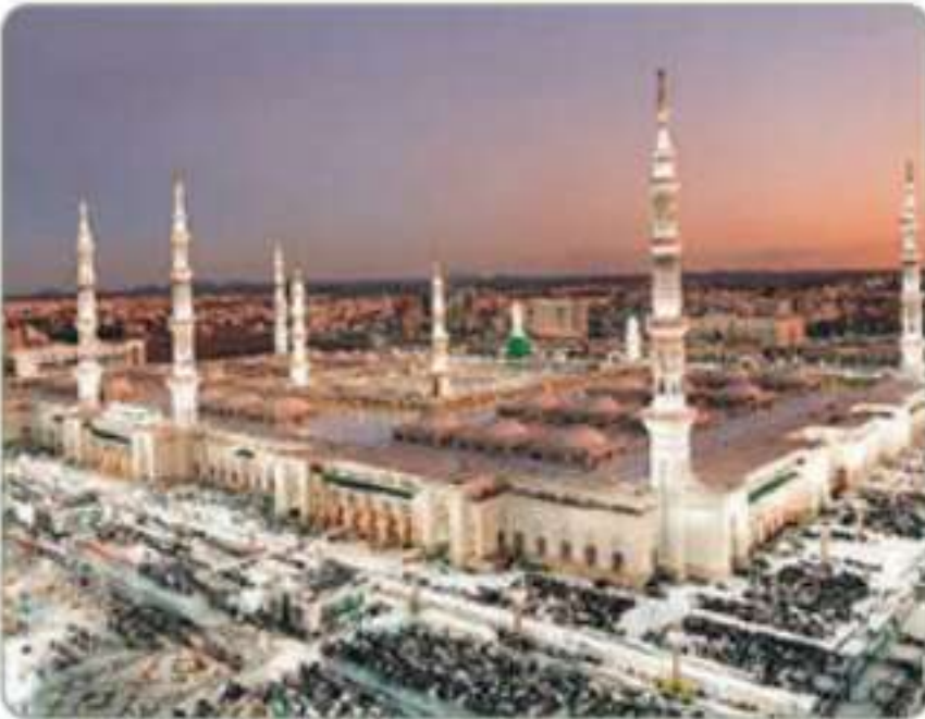
المسجد النبوي بالمدينة المنورة

تشغل المملكة العربية السعودية معظم الجزيرة العربية، وتقع في الزاوية الجنوبية الغربية من قارة آسيا، لتصبح في موقع متميز جعلها ملتقى لقارات آسيا وإفريقيا وأوروبا. يتميز هذا الموقع بأنه جعل الجزيرة العربية في الماضي وإلى اليوم مكان اتصال ورابطاً حضارياً بين دول العالم من نواحٍ مختلفة: فمن الناحية الاقتصادية أصبحت الجزيرة العربية محورياً مهماً في العلاقات بين دول هذه القارات الثلاث ومجتمعاتها، ومن الناحية الاجتماعية كانت الجزيرة العربية مصدر هجرات السكان إلى دول أخرى، ومن الناحية الثقافية تمكنت الجزيرة العربية من التأثير بمحيطها الذي ترتبط به. ومن الناحية الدينية أصبحت الجزيرة العربية مصدر إشعاع للعالم عندما ظهر الإسلام وانتشر في مناطق كثيرة.