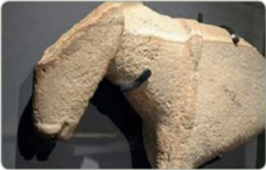
مجسم أثري لخيّل من معثورات حضارة المقرّ

ثمة حضارات قديمة قامت على أرض الجزيرة العربية، يُعدّد الطلبة بعضها.