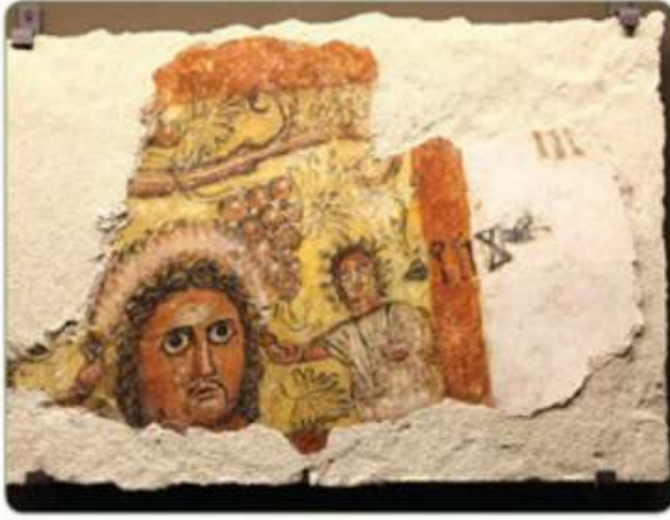
لوحة جدارية من الفاو