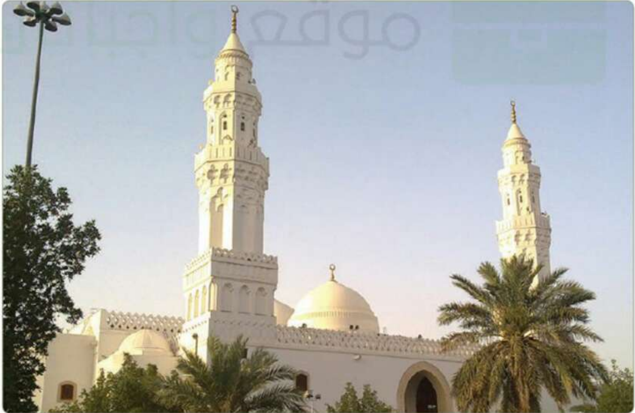
مسجد القبلتين بالمدينة المنورة

ونزل الأمر من الله تعالى بتحويل القبلة إلى مكة المكرمة في قوله تعالى: ﴿قَدْ زَرَى تَقَلُّبَ وَجْهِكَ فِي السَّمَاءِ فَلَنُوَلِّيَنَّكَ قِبْلَةً تَرْضَاهَا فَوَلِّ وَجْهَكَ شَطْرَ الْمَسْجِدِ الْحَرَامِ وَحَيْثُ مَا كُنْتُمْ فَوَلُّوا وُجُوهَكُمْ شَطْرَهُ﴾ [البقرة: 144]. وجاء في كتب السيرة النبوية أن النبي محمداً صلى الله عليه وسلم كان في زيارة لأم بشر بنت البراء فنزلت عليه الآية وأبلغ الصحابة رضي الله عنهم وتحولوا في صلاتهم إلى الكعبة المشرفة في مكة المكرمة. وما زال في المدينة المنورة مسجد القبلتين الذي تحول فيه الصحابة في صلاتهم فاستقبلوا مكة المكرمة بعدما جاءهم الخبر بنزول الآية.