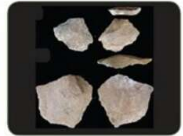
بعض الأدوات الحجرية القديمة في موقع الشويحطية