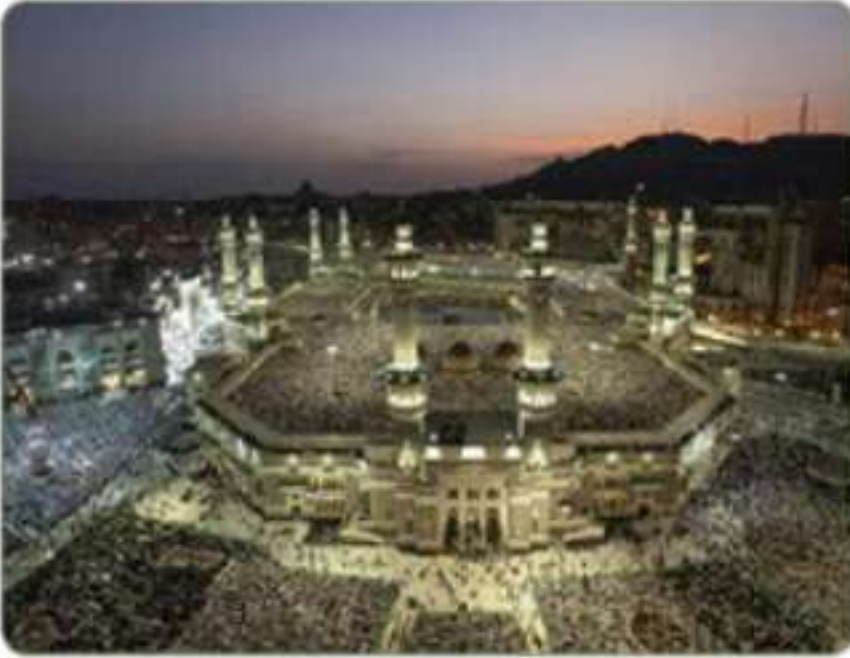
المسجد الحرام بمكة المكرمة

مساحة الجزيرة العربية نحو ٣,٥ ملايين كم ٢ ، وتشغل المملكة العربية السعودية قرابة ثلثي مساحتها، أي نحو مليوني كيلومتر مربع.