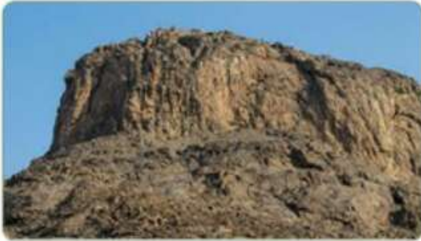
جبل النور بمكة المكرمة

يقع شمال شرق المسجد الحرام بمكة المكرمة على مسافة ٤ كم، وفي قمته (غار حراء) الذي كان