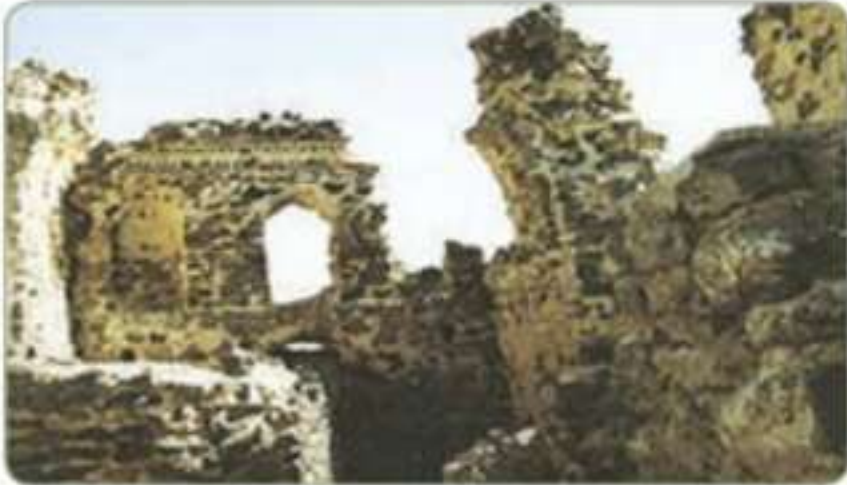
قصر سعيد بن العاص

بناه سعيد بن العاص أمير المدينة المنورة في عهد معاوية بن أبي سفيان، وهو على جانب وادي العقيق في المدينة المنورة، ولا تزال بعض أطلاله باقية إلى اليوم.