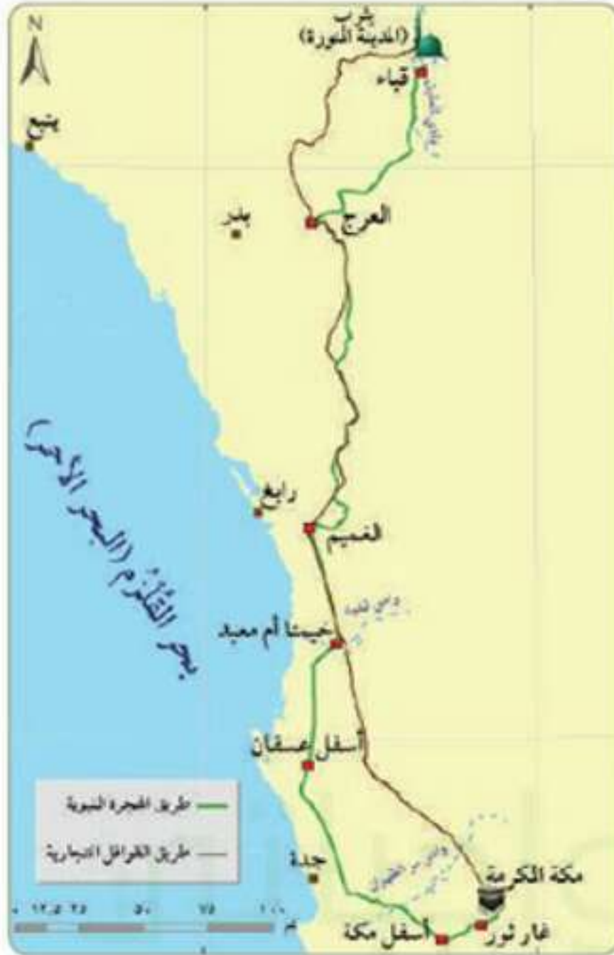
طريق الهجرة النبوية