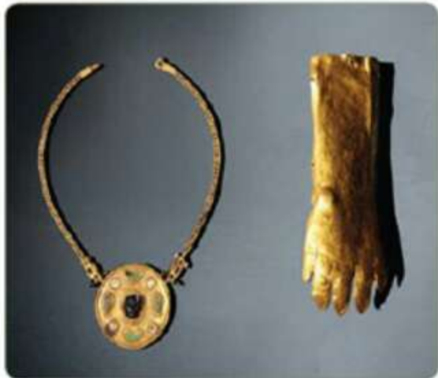
كنز ثاج من عصر الجرفاء