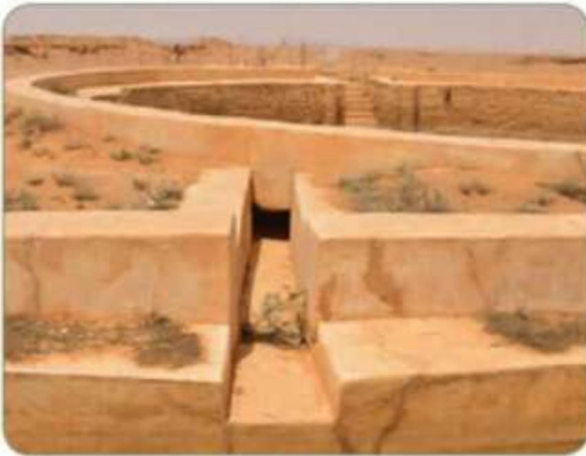
بركة الثليمة في درب زبيدة بمنطقة الحدود الشمالية

وكان البخور يستعمل بكثرة في طقوس الرومان واليونان الدينية القديمة، وأصبح من أبرز المواد التي لها طلب كبير جداً، وهو ما نشط هذا الطريق بشقيه البري والبحري. وكان في نجران والفاو في المملكة العربية السعودية محطتان مهمتان في هذا الطريق، إضافة إلى الموانئ القديمة على البحر الأحمر.