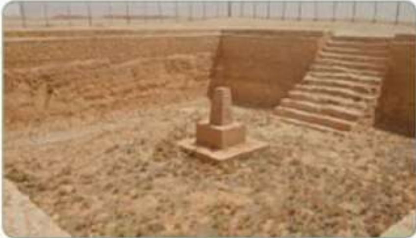
بركة الثلثية في درب زبيدة

موضع لأشهر أسواق العرب قبل الإسلام وفي عصر صدر الإسلام، وهو على مسافة ٤٠ كم شمال مدينة الطائف. كان سوقاً للعرب، ومنتدى للشعراء، وملتقى اجتماعياً كبيراً لقبائل العرب.