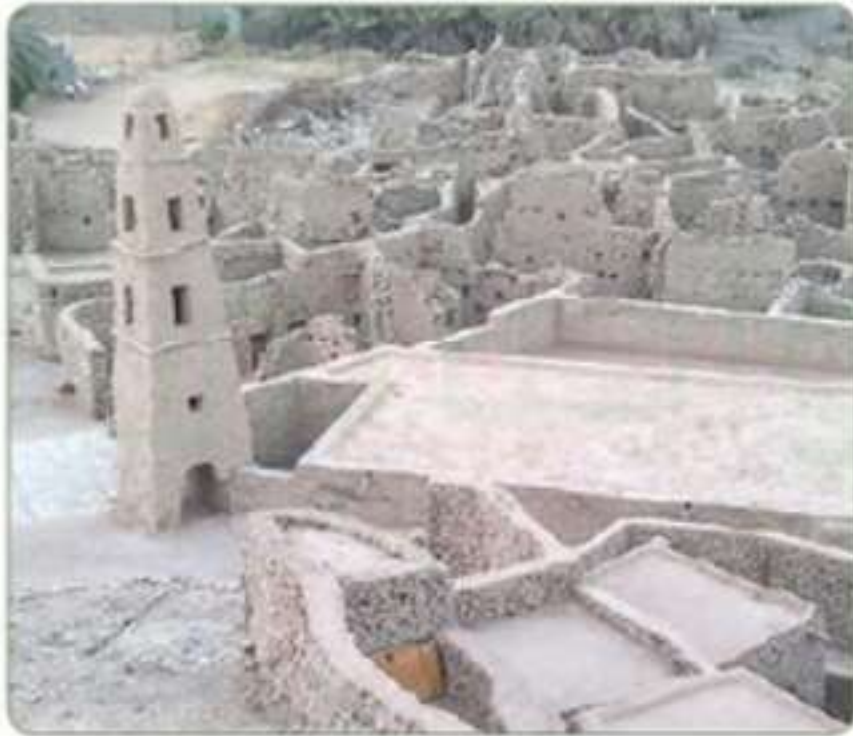
دومة الجندل بمنطقة الجوف