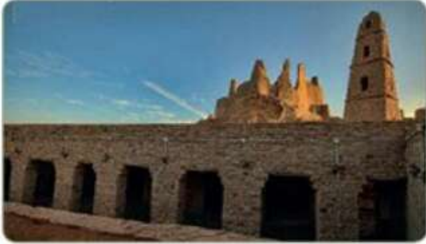
مسجد الخليفة عمر بن الخطاب

يعود بناء هذا المسجد إلى عهد الخليفة عمر ابن الخطاب، وهو في دومة الجندل بمنطقة الجوف.