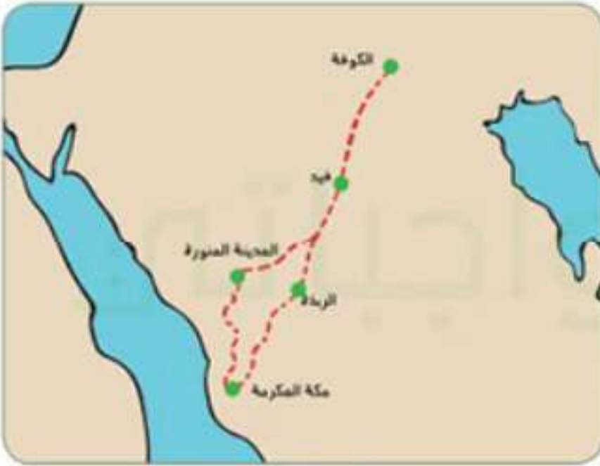
مسار درب زبيدة

مسافته من الكوفة إلى مكة المكرمة نحو ١,٥٠٢ كم، وعدد محطاته ٥٧ محطة. وتقطع قافلة الحج الطريق على ظهور الجمال في مدة تصل إلى شهر.