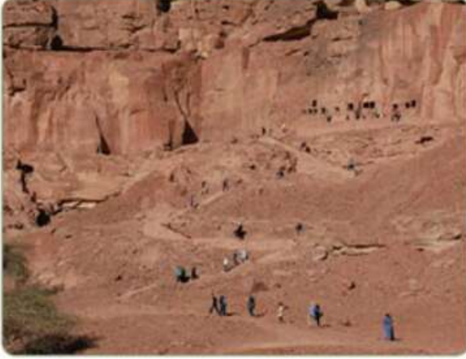
آثار لحيانية في الحُربة بالعلّاء