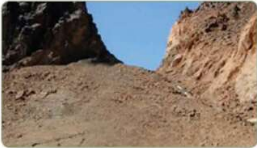
طريق الهجرة النبوية