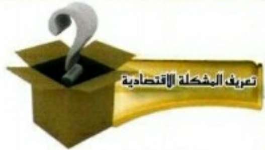
تعريف المشكلة الاقتصادية

إذا كان لديك مبلغ من النقود يكفي لشراء كتاب أو ثوب فأيهما تختار ؟ إذا كان لديك فراغ يومين في عطلة نهاية الأسبوع، هل تزور أقاربك في مدينة أخرى أم تذهب في عمرة أم تمكث في بيتك تنهي بعض الأعمال المتأخرة ؟ إذا كان لدى أهل الحي قطعة أرض فهل يبنون عليها وحدة صحية أم مدرسة أم متنزهًا للأطفال ؟ إذا كان لدى المجتمع أراض زراعية فهل يزرعها قمحًا أم شعيرًا أم ذرة ؟ هذه الأسئلة وغيرها أمثلة على المشكلة التي تواجه الفرد والمجتمع منذ وجد الإنسان على الأرض والتي نسميها المشكلة الاقتصادية.