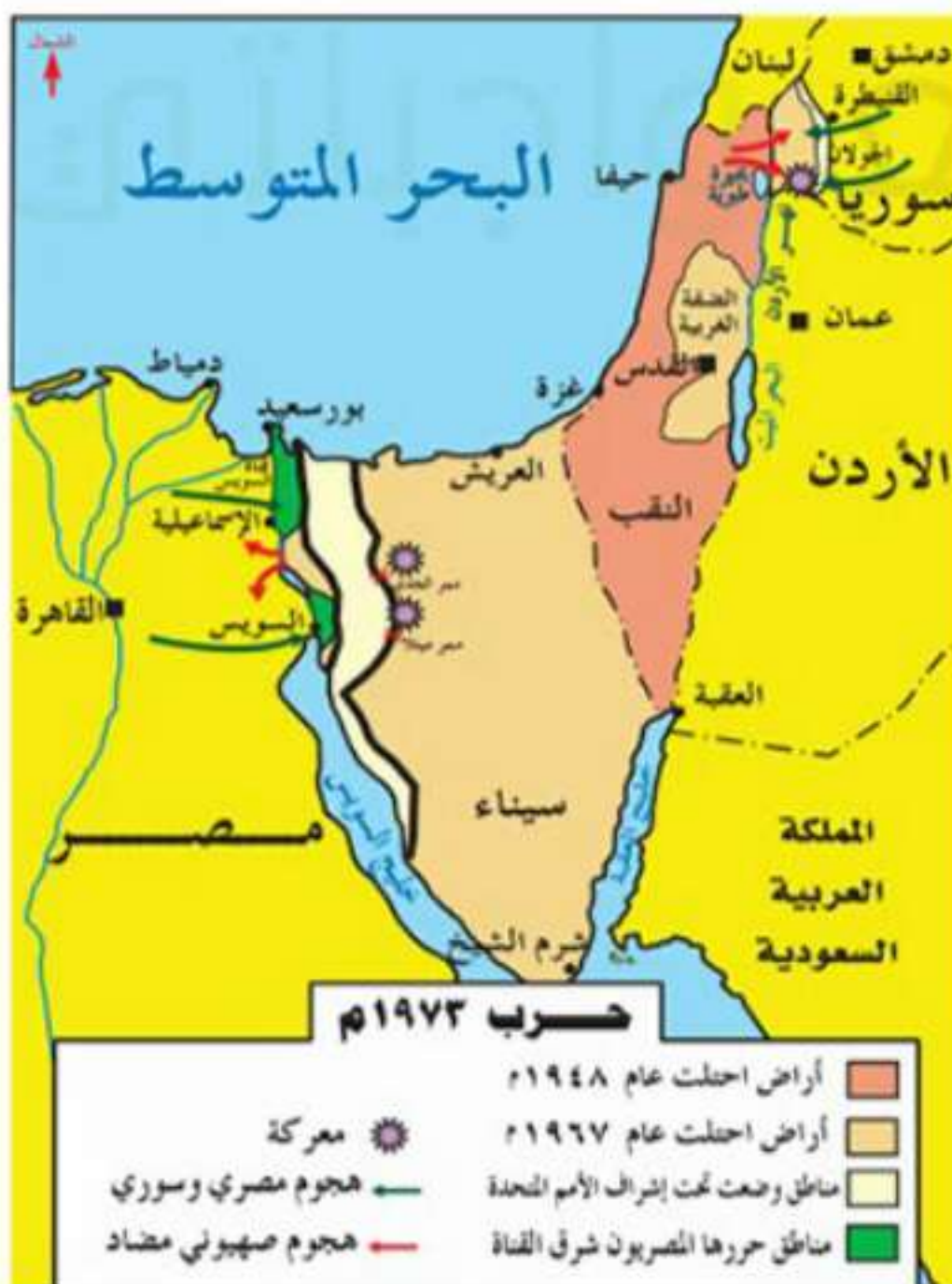
▲ حرب ١٩٧٣م

الحربي في مصر وسوريا، أصدر مجلس الأمن قراراً بإيقاف الحرب وبدء المحادثات للوصول إلى حلول سلمية. ومن نتائج هذه الحرب ارتفاع الروح المعنوية العربية، وظهور أهمية التنسيق العربي، وكسب تأييد الدول الإفريقية ودول عدم الانحياز.