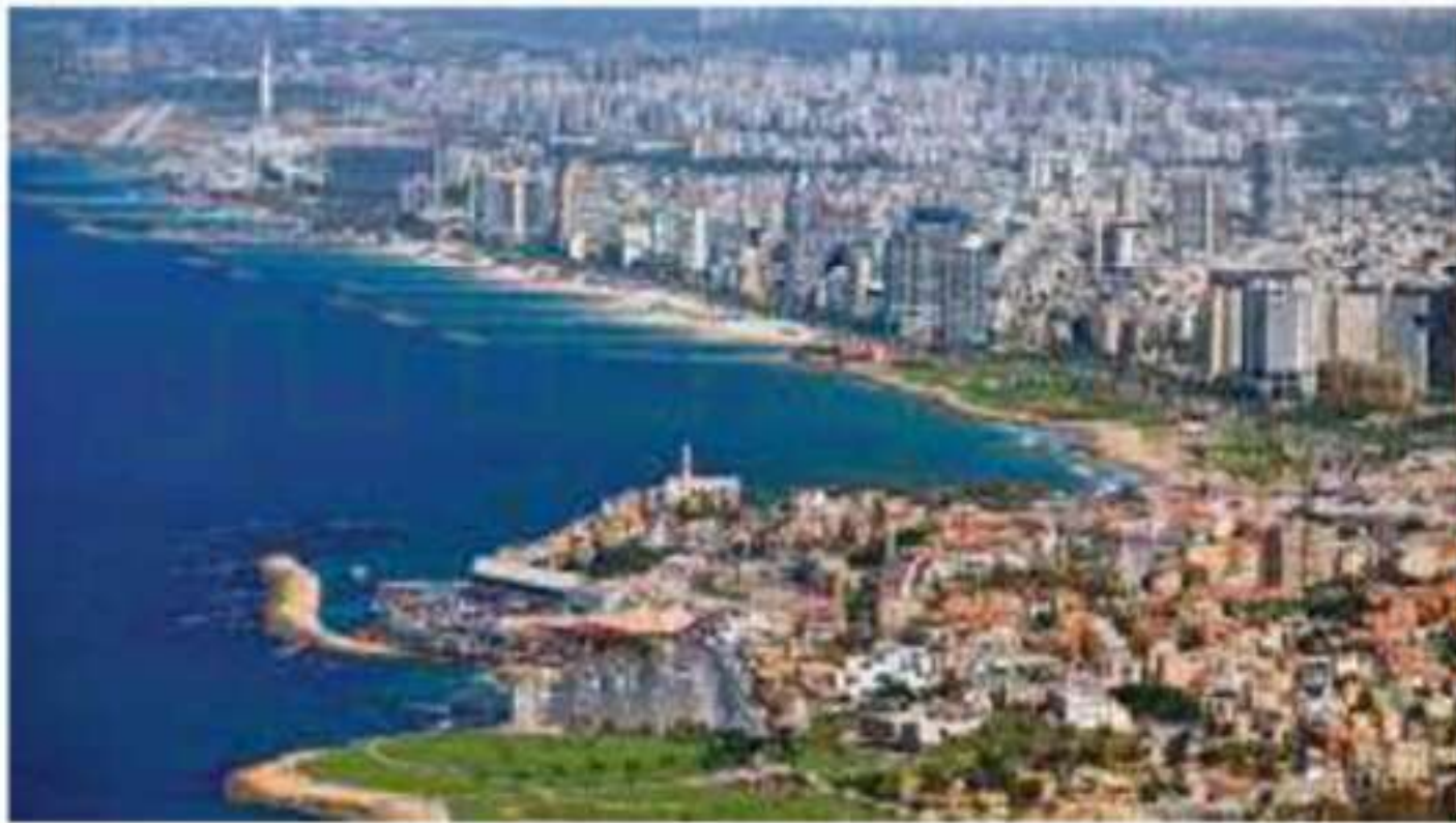
صورة جوية لمدينة يافا بفلسطين

الإضراب العام في جميع أنحاء فلسطين واستمر ستة أشهر احتجاجاً على الهجرة اليهودية لفلسطين، ثم تشكلت لجنة تسمى (اللجنة العربية العليا)، وأصدرت مجموعة من القرارات في أول بيان لها، حددت فيه أربعة مطالب رئيسية، هي: ١- العدول عن فكرة الوطن القومي اليهودي الناشئة عن وعد بلفور.