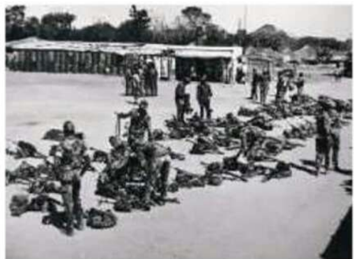
▲ صورة من حرب عام ١٩٧٣م