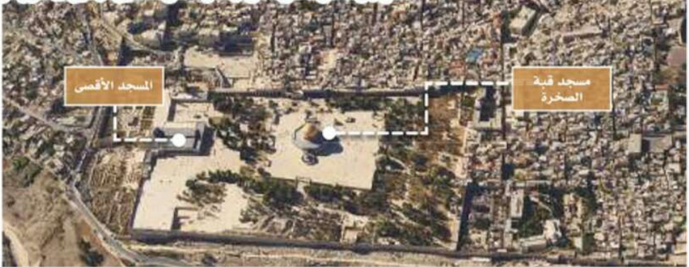
المسجد الأقصى يشمل كل ما هو داخل في السور

الإسراء : هو الرحلة الارضية التي هياها الله لرسوله صلى الله عليه وسلم من مكة الى القدس من المسجد الحرام الي المسجد الاقصى، رحلة أرضية ليلية والمعراج : رحلة من الارض الى السماء، من القدس إلى السماوات . العلاء الي مستوى لم يصل إليه بشر من قبل، إلى سدرة المنتهي، إلى حيث يعلم الله قال تعالى: " سبحان الذي أسرى بعبده ليلا من المسجد الحرام الي المسجد الاقصى الذي باركنا حوله لنريه من آياتنا إنه هو السميع البصير" [ سورة الإسراء : آية ١