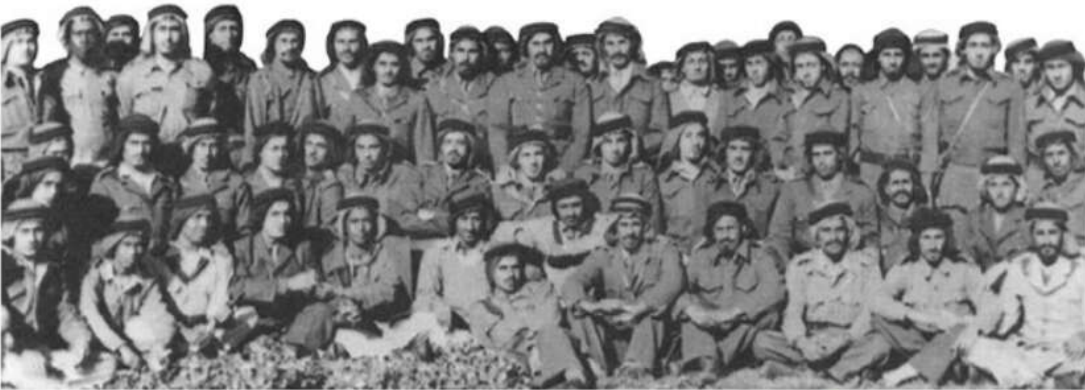
▲ مجموعة من الجنود السعوديين الذين شاركوا في حرب فلسطين عام ١٣٦٧هـ / ١٩٤٨م