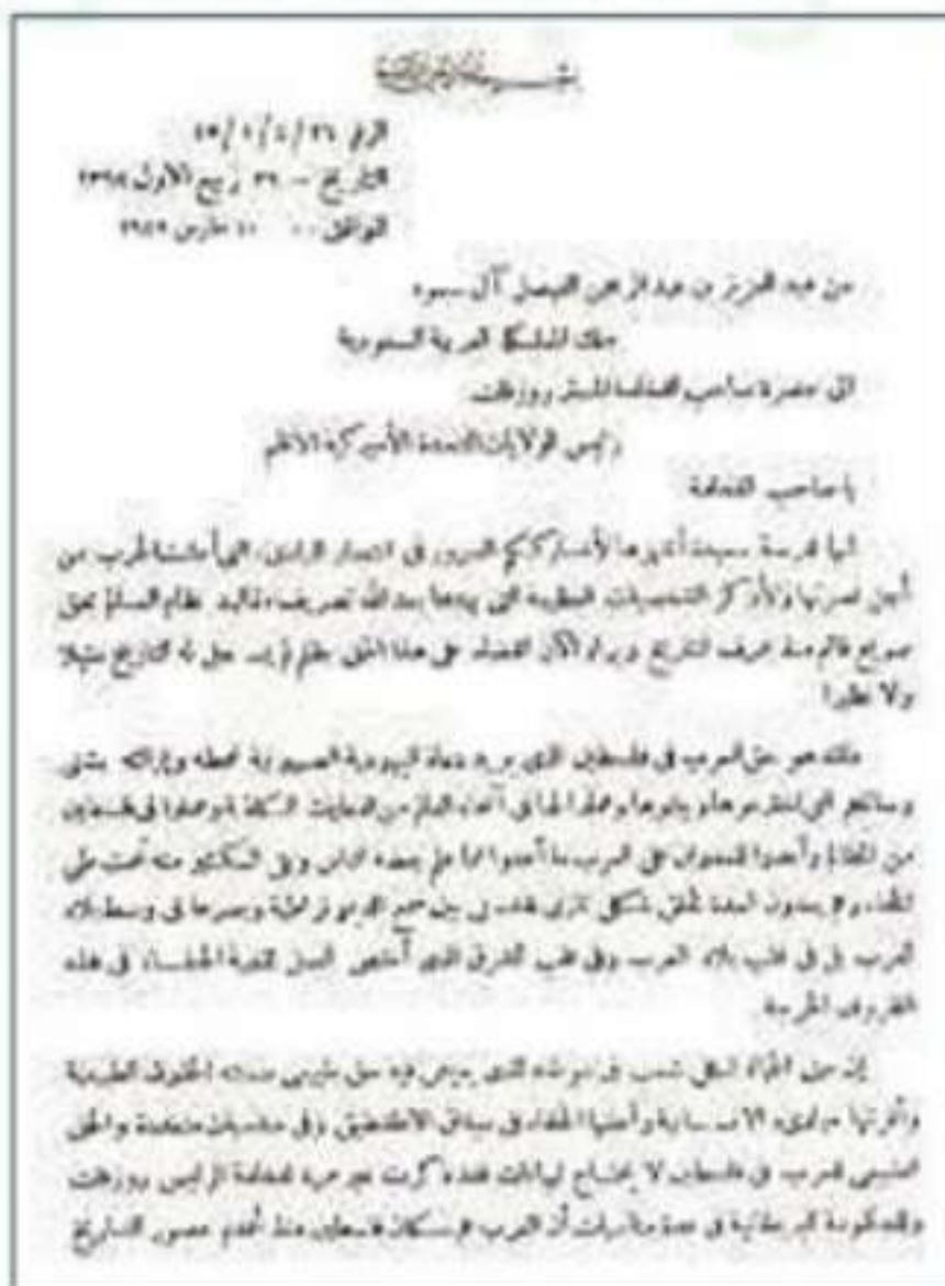
صورة للصفحة الأولى لرسالة الملك عبد العزيز للرئيس الأمريكي (فرانكلين روزفلت)

لكن بريطانيا تراجعت عن وعدها للعرب بعد الحرب العالمية الثانية وأعلنت الحكومة البريطانية تراجعها عن الكتاب الأبيض عام ١٣٦٤هـ/ ١٩٤٥م.