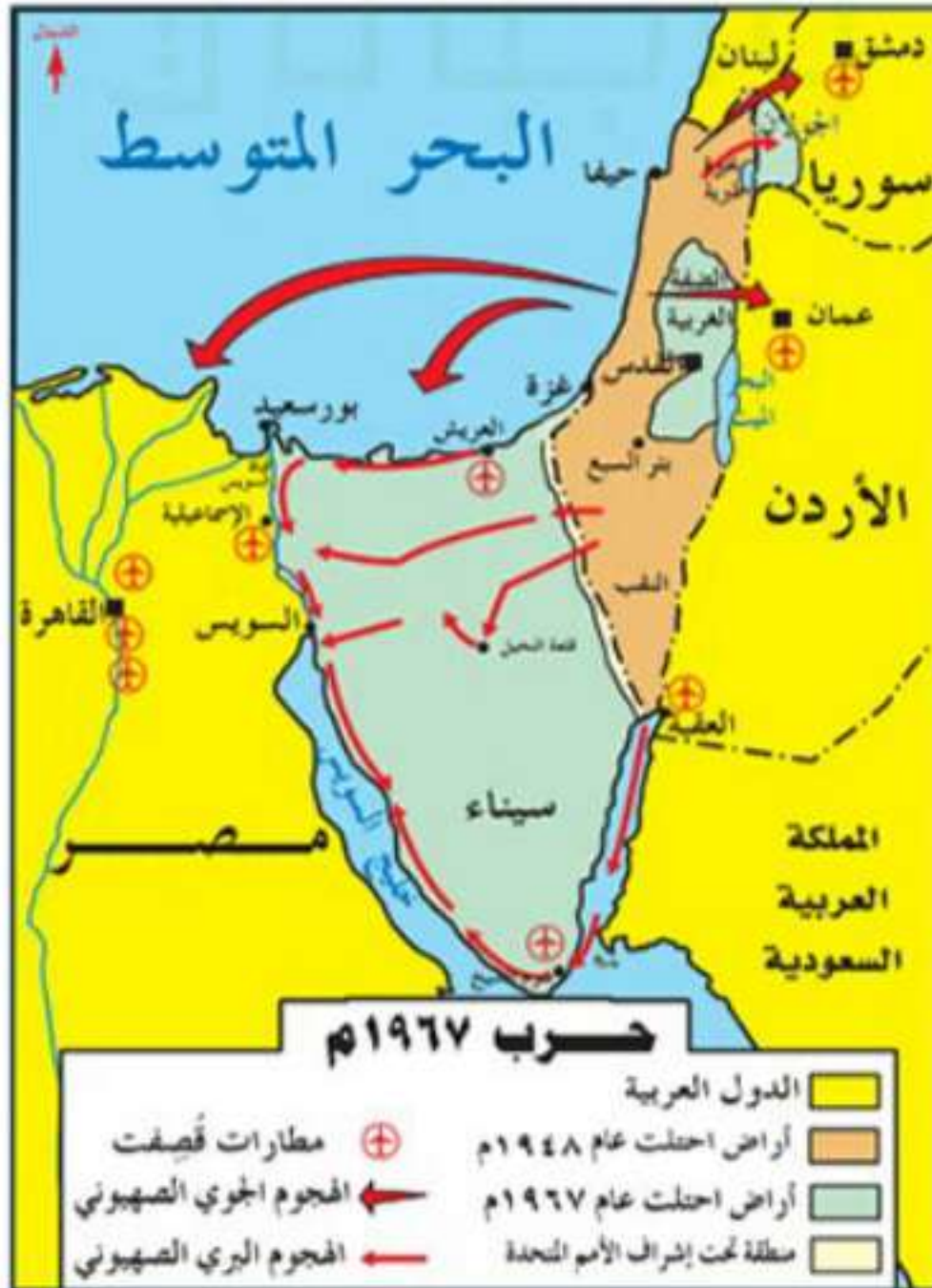
▲ حرب النكسة الكبرى

وصارت النسبة المتبقية للعرب من فلسطين (٢٣٪). كما احتل العدو الصهيوني شبه جزيرة سيناء المصرية، ومرتفعات الجولان السورية.