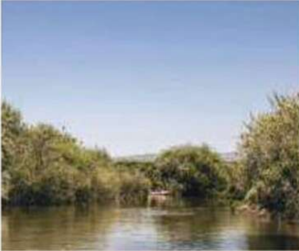
▲ نهر الأردن

يجري نهر الأردن في شمال شرقي فلسطين، ويعد أعظم أنهار فلسطين وأكبرها، وينبع من جبل الشيخ إذ تغذي منابعه ثلاثة أنهار رئيسة هي: بانياس في سورية، والحاصباني في لبنان، والدان في فلسطين. ويجري نهر الأردن من سهل الحولة شمالاً منحدرًا نحو بحيرة طبرية فيصب فيها، ثم يخرج من طرفها الجنوبي، وعندئذ تغذيه روافد متعددة أكبرها نهر اليرموك، ثم يواصل جريانه نحو الجنوب حتى يصب في البحر الميت. ويقدر حجم المياه التي يصبها نهر الأردن في البحر الميت بنحو ١٢٠٠ مليون متر مكعب في العالم.