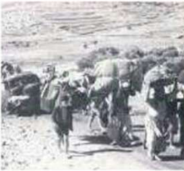
▲ فلسطينيون نازحون عن ديارهم بعد الحرب