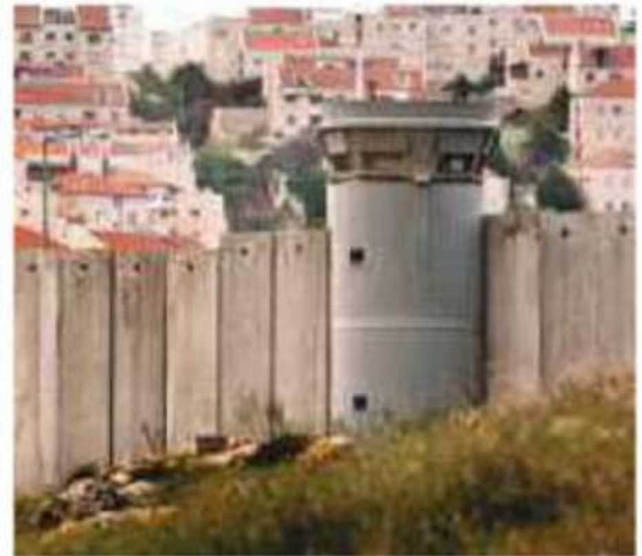
▲ إنشاء مستوطنات اليهود المحتلين في فلسطين