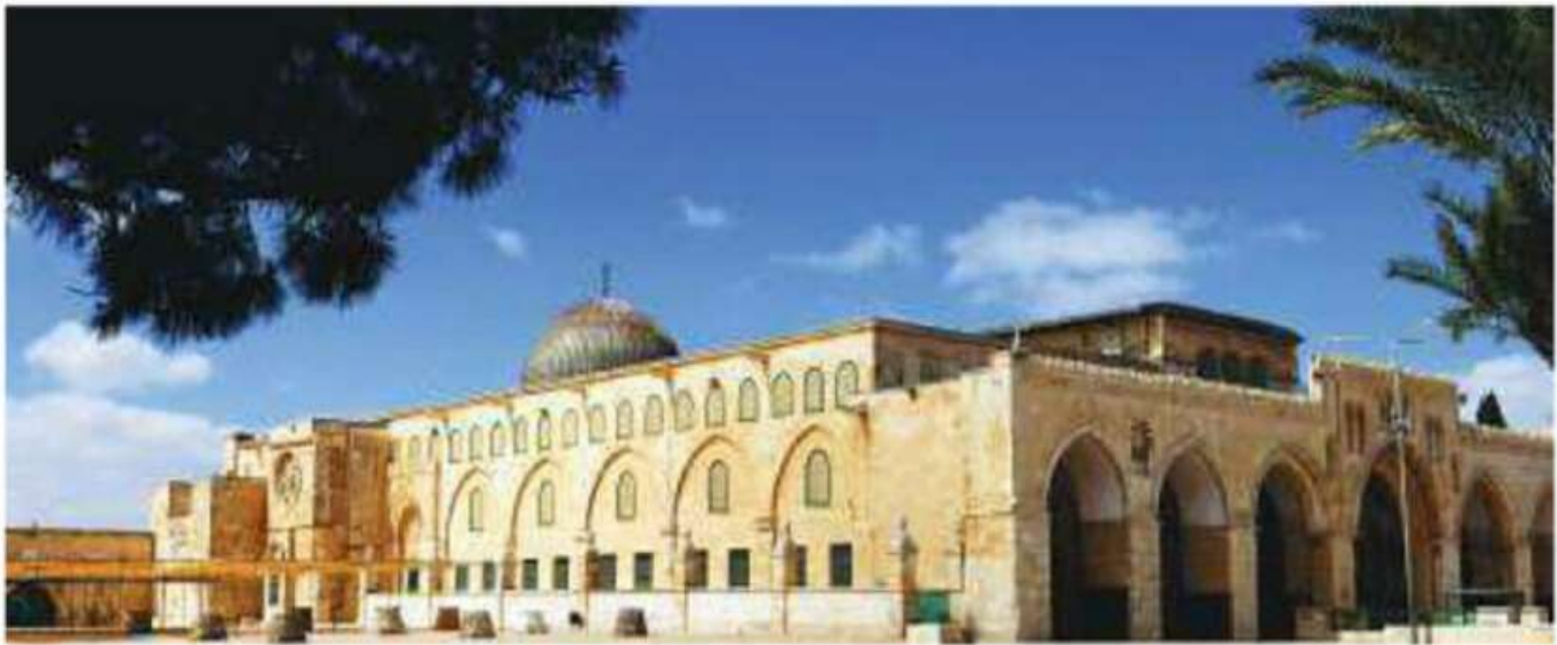
المسجد الأقصى المبارك

وتتخلل هذه المرتفعات السهول والأودية، وأهم المدن فيها: صفد، والناصرية، ونابلس، ورام الله، والقدس، وبيت لحم، والخليل.