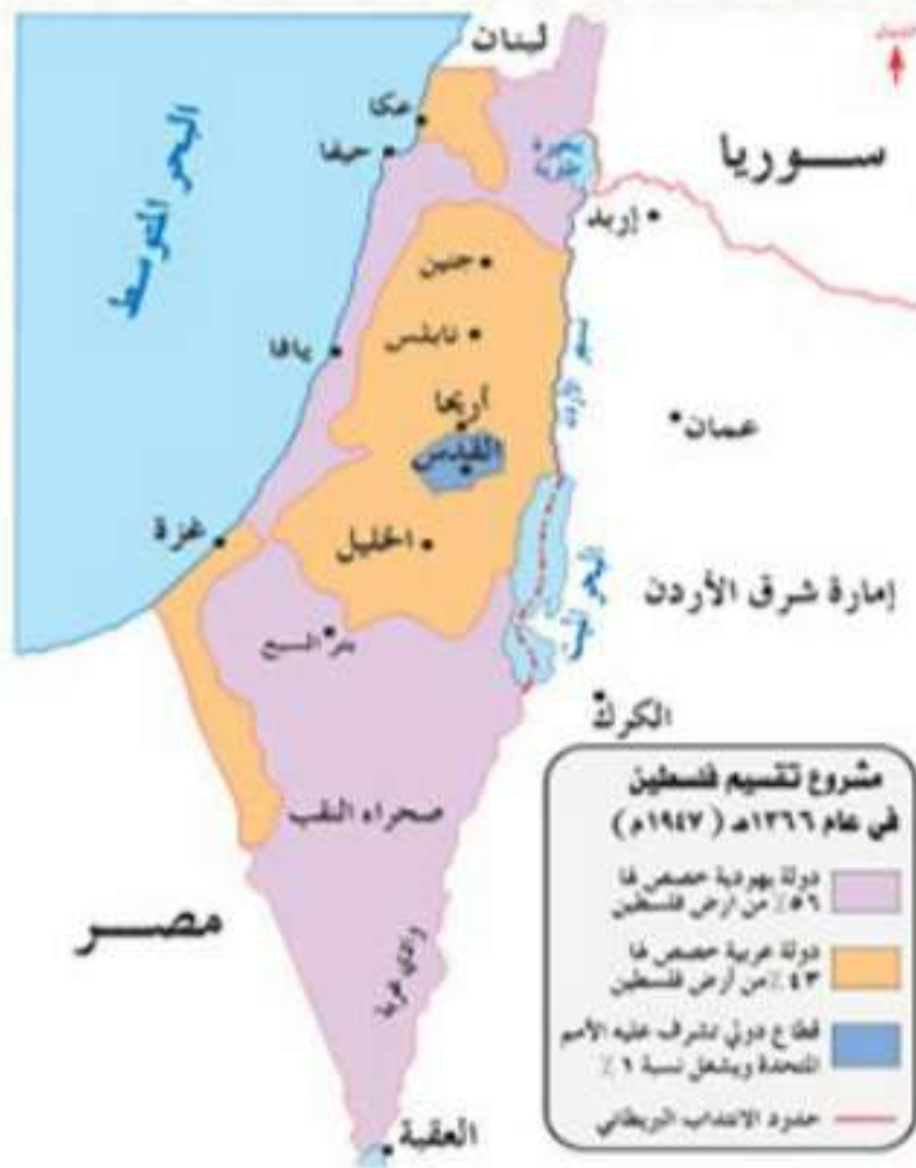
مشروع تقسيم فلسطين