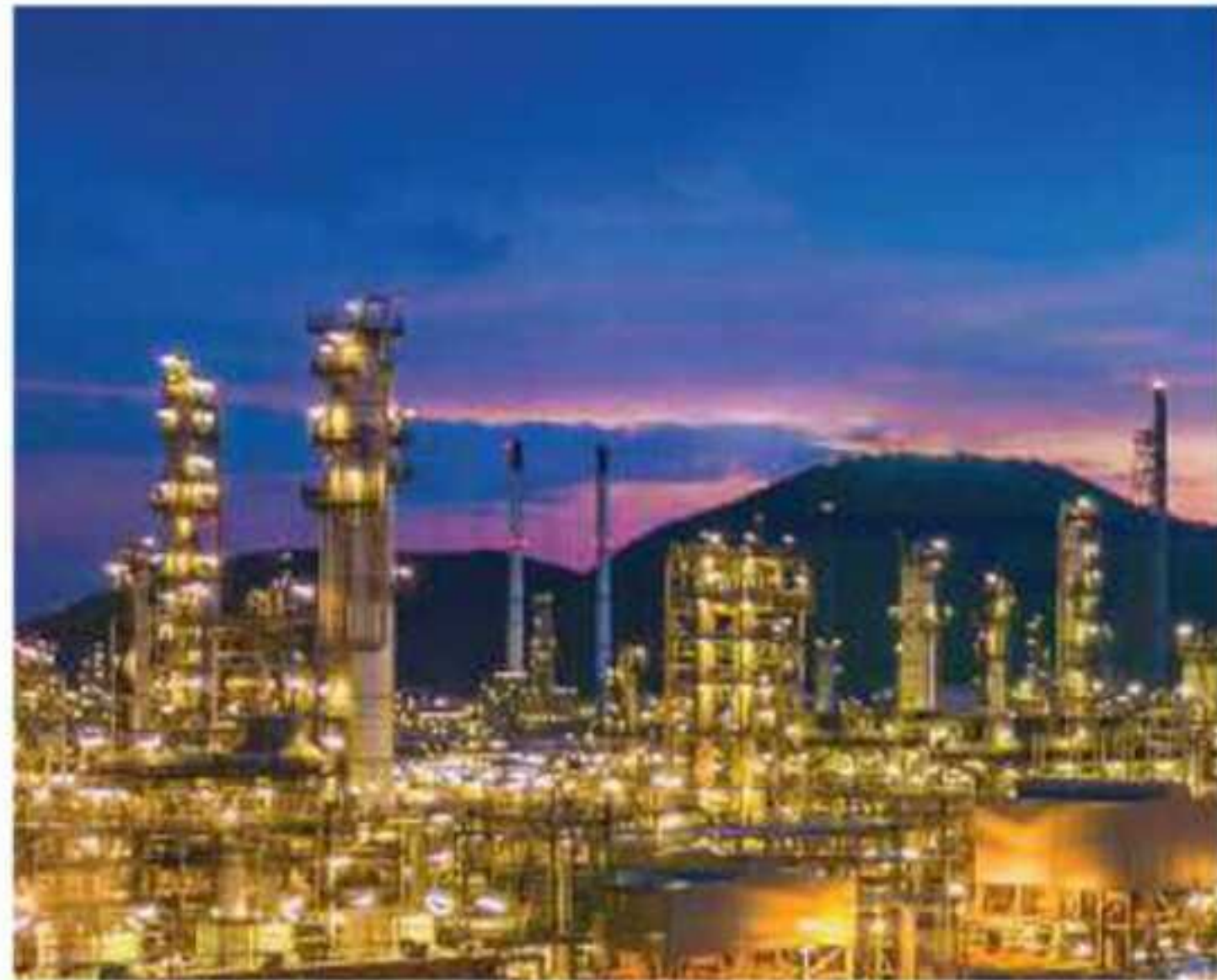
▲ شركة أرامكو السعودية

تحظى المملكة العربية السعودية بمكانة اقتصادية متفردة بين دول العالم، فهي تقع على عدد من المنافذ البحرية المهمة، وهي من أكبر الدول إنتاجاً للنفط وتصديراً له، وتمتلك احتياطياً نفطياً هائلاً، جعلها من الدول القيادية الفاعلة في منظمة (أوبك)، وهي أيضاً من كبريات الدول المنتجة للغاز الطبيعي، وتمتلك كثيراً من المعادن المختلفة.