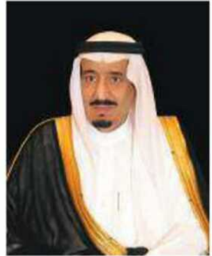
خادم الحرمين الشريفين الملك سلمان بن عبدالعزيز آل سعود ملك المملكة العربية السعودية