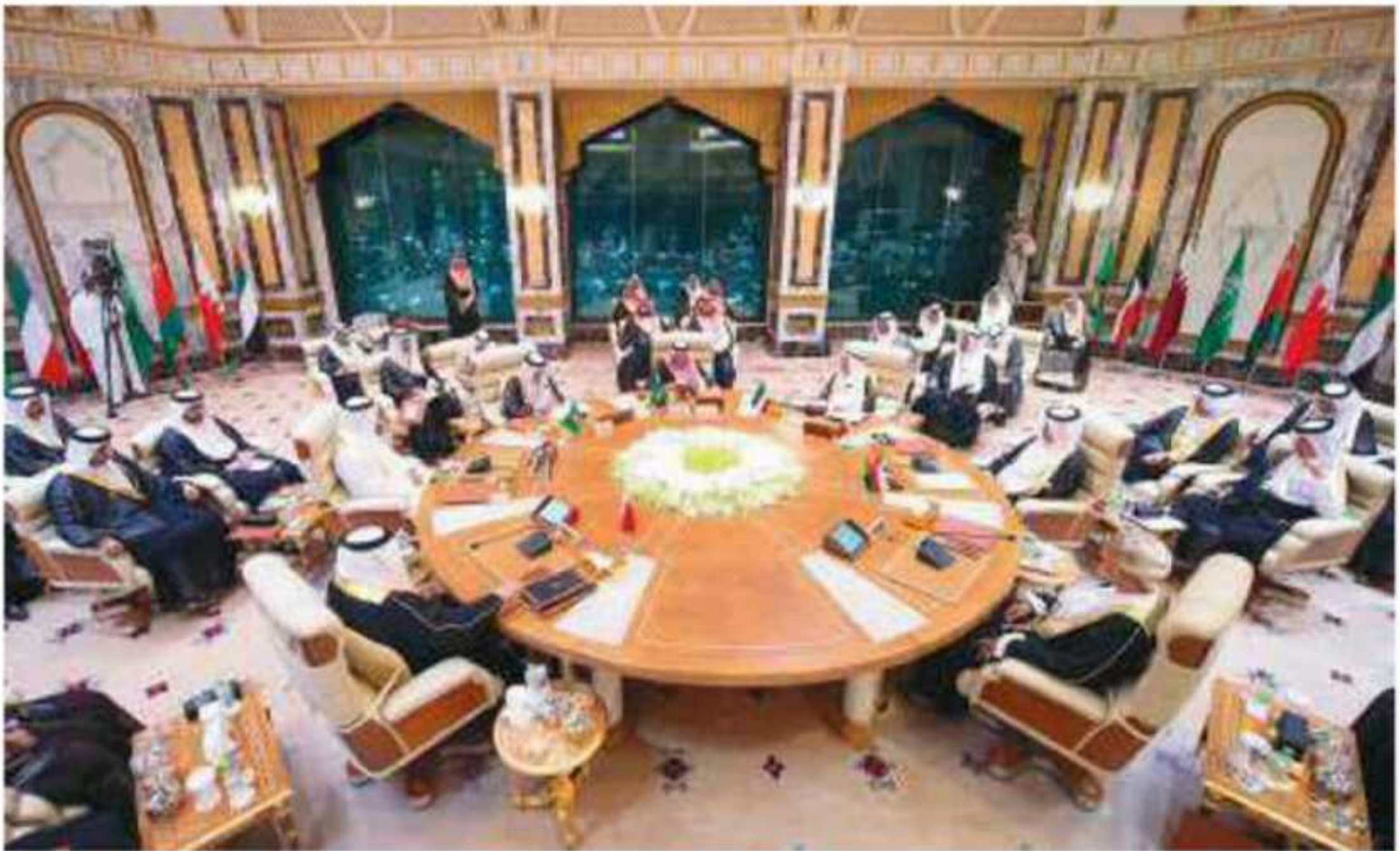
▲ قمة مجلس التعاون لدول الخليج العربية في مكة المكرمة عام ١٤٤٠هـ.

والتكامل والترابط بينها في جميع الميادين. دول الخليج يربطها بالعالم واشرافها على مضيق هرمز المهم ودول الخليج متوسطة بين قارات جول العالم القديم