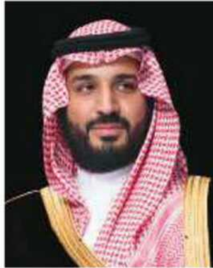
الأمير محمد بن سلمان بن عبدالعزيز آل سعود ولي العهد، نائب رئيس مجلس الوزراء، وزير الدفاع

وهذا من أهم مقومات المملكة العربية السعودية من حيث أساسها السياسي المستقر والقائم على مبادئ إسلامية، وتاريخها العريق الأصيل على أرض الجزيرة العربية، وكذلك اعتماد النظام الملكي على البيعة، وهو مبدأ إسلامي أصيل، يؤدي إلى الاستقرار وتحقيق المصالح العامة شرعاً ومصدراً.