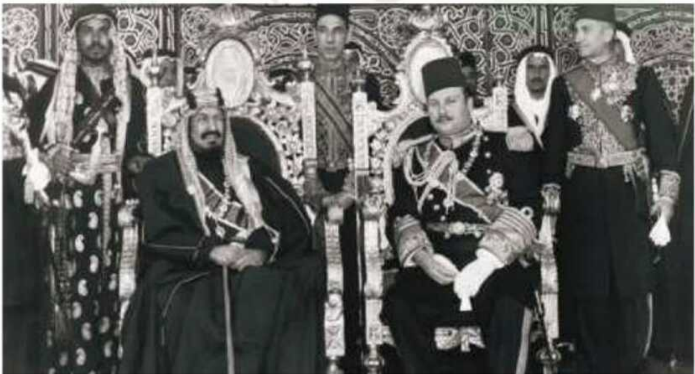
▲ زيارة الملك عبدالعزیز إلى مصر عام ١٣٦٥هـ

وعندما هاجم مصر العدوان الثلاثي عام ١٣٧٦هـ وقفت المملكة العربية السعودية مع مصر بكل ثقلها، وقدمت لمصر دعماً مالياً كبيراً، وقدمت لها عشرين طائرة حربية، كما استضافت طائراتها التي لجأت إلى المملكة إثر كثافة غارات الأعداء عليها.