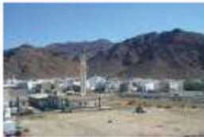
▲ جبل أحد في المدينة المنورة

قامت على أرض المملكة العربية السعودية ممالك وحضارات قديمة، مثل: كندة ودومة الجندل ومدين. كما شهدت مكة المكرمة مبعث خاتم الأنبياء وأشرف المرسلين محمد بن عبدالله ﷺ، وتأسيس الدولة في العهد النبوي وعاصمتها المدينة المنورة، التي نشرت الإسلام في أرجاء الجزيرة العربية، ثم إلى سائر بقاع العالم، وشهدت أيضاً أحداث عهد الخلفاء الراشدين ﷺ.