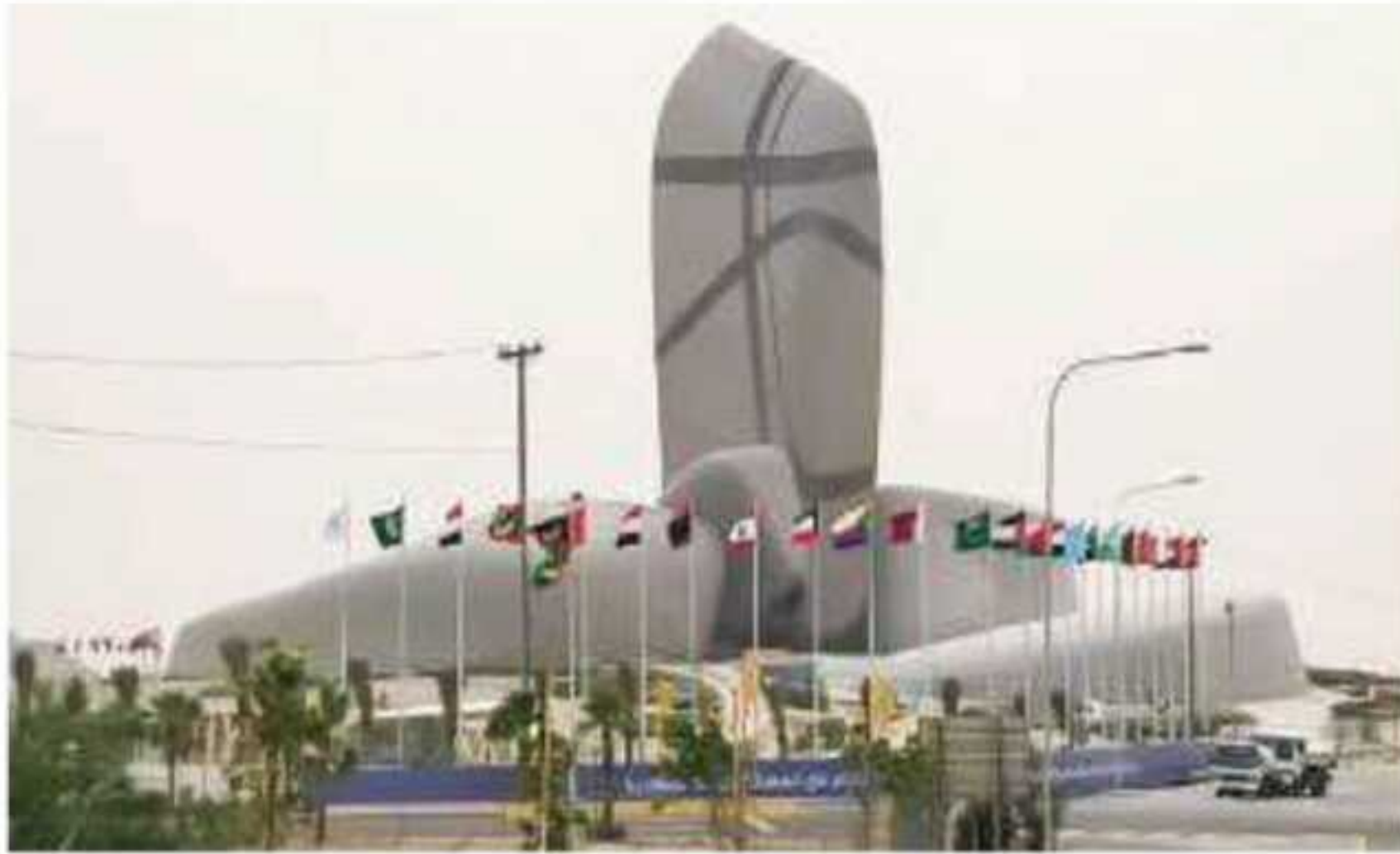
▲ مركز الملك عبدالعزيز الثقافي العالمي بالظهران حيث تم عقد القمة العربية عام ١٤٢٩هـ

«إيماناً منا بأن الأمن القومي العربي منظومة متكاملة لا تقبل التجزئة، فقد طرحنا أمامكم مبادرة للتعامل مع التحديات التي تواجهها الدول العربية بعنوان (تعزيز الأمن القومي العربي لمواجهة التحديات المشتركة)، مؤكداً على أهمية تطوير جامعة الدول العربية ومنظومتها، كما نرحب بما توافقت عليه الآراء بشأن إقامة القمة العربية الثقافية، آملياً أن تسهم في دفع عجلة الثقافة العربية الإسلامية».