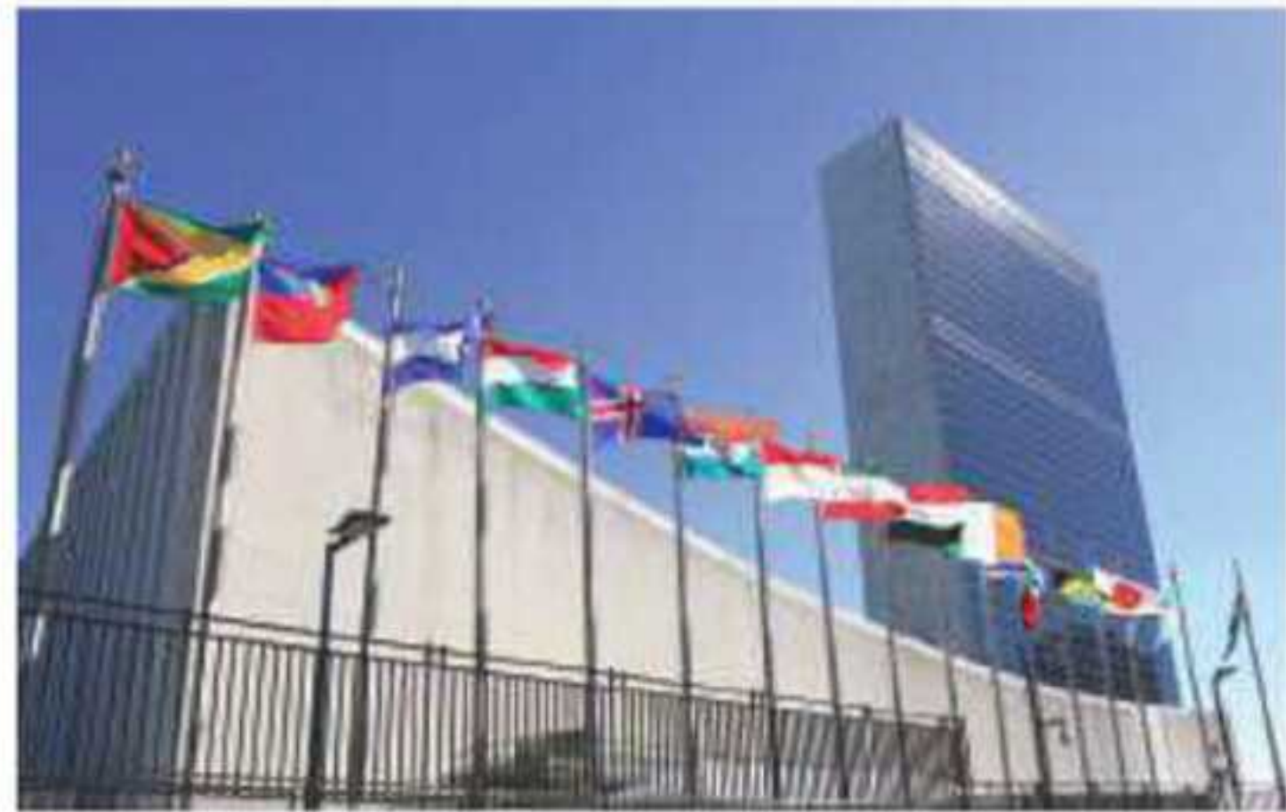
▲ مبنى هيئة الأمم المتحدة في نيويورك