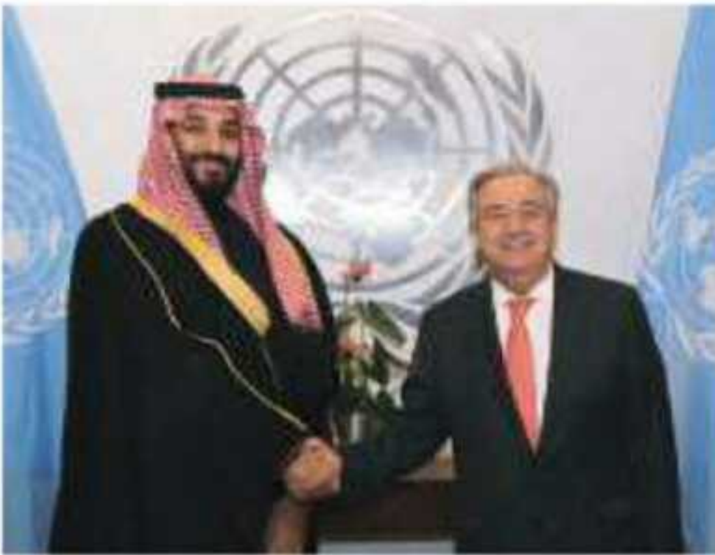
⚠️ صاحب السمو الملكي الأمير محمد بن سلمان بن عبدالعزيز آل سعود في لقاء مع الأمين العام لهيئة الأمم المتحدة السيد أنطونيو غوتيريس عام ١٤٣٩هـ

عندما أعلنت الحرب العالمية الثانية في عام ١٣٥٨هـ / ١٩٣٩م التزم الملك عبدالعزيز ﷺ الحياد في هذه الحرب حفاظاً على بلاده ومقدساتها، وعبر لقاءات عدة واجتماعات متواصلة إبان الحرب العالمية الثانية تقرّر عقد مؤتمر لتأسيس الأمم المتحدة في مدينة سان فرانسيسكو بالولايات المتحدة الأمريكية،