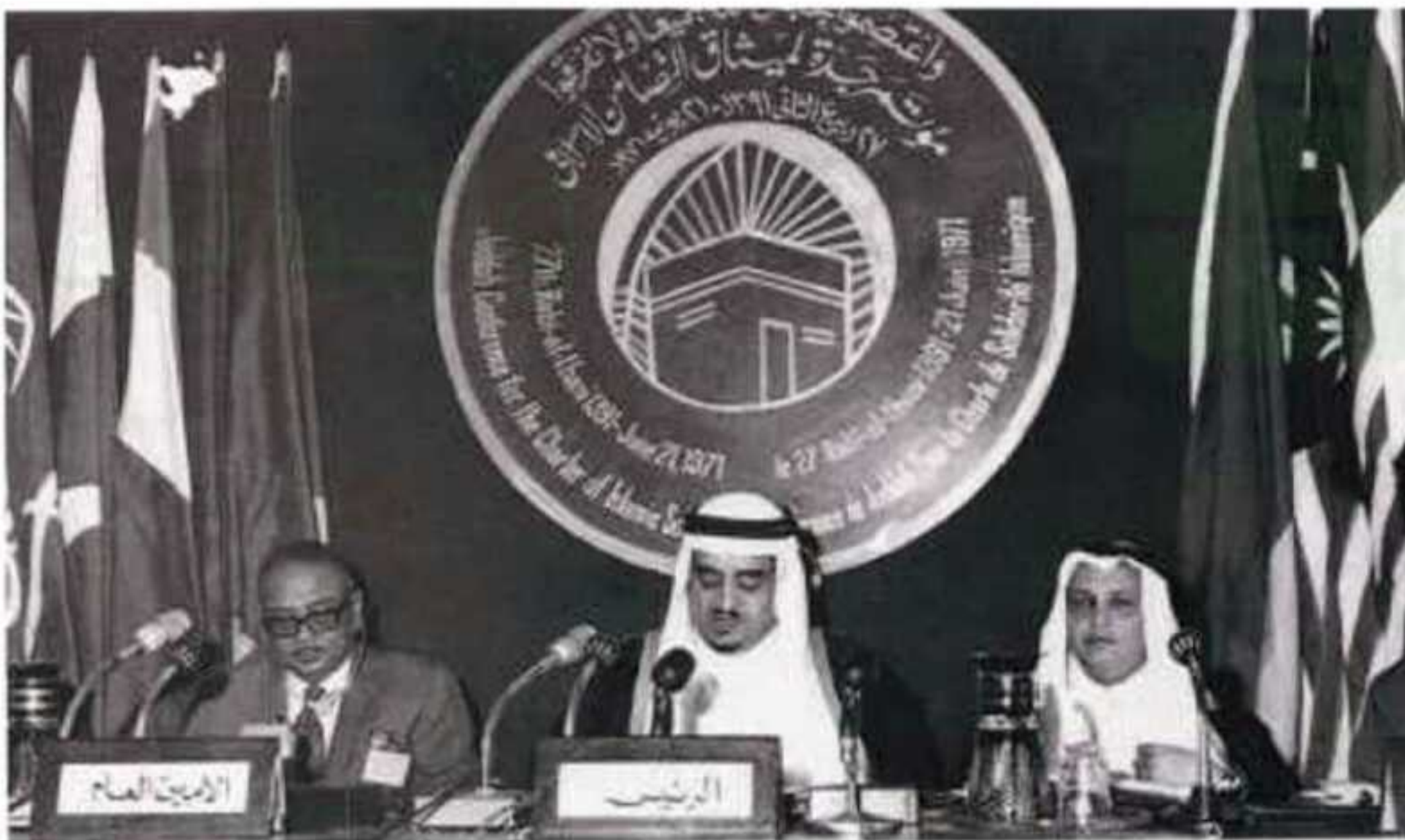
الملك فهد بن عبد العزيز يترأس جلسات مؤتمر جدة لميثاق التضامن الإسلامي عام ١٣٩١هـ

لم تقف جهود المملكة على دعم التضامن الإسلامي، بل تعدت ذلك، حيث قدمت المملكة للعالم الإسلامي من طريق صندوق النقد الدولي تسهيلات بلغت قيمتها مليارات الدولارات، كانت حصة المملكة منها ٤٥٪ من قيمة تلك القروض والتسهيلات، وذلك في سبيل دعم القضايا الإسلامية، إضافة إلى مليار دولار خصصتها المملكة عام ١٣٩٥هـ لمساعدة التنمية في إفريقيا.