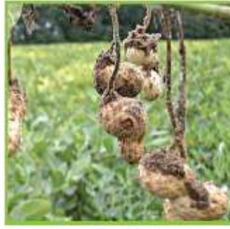
بذور الفول السوداني