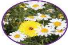
تسطير دورة حياة الأزهار أشهر هيلينا