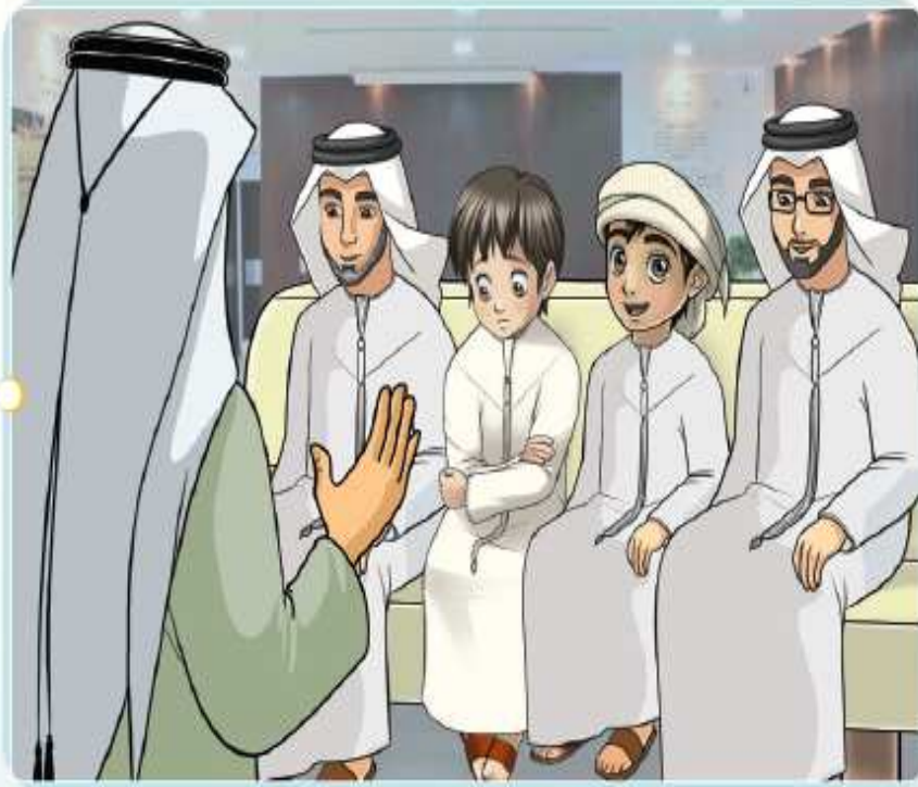
مَجْمُوعَةٌ مِنَ النَّاسِ فِي عُرْفَةِ الْإِنْتِظَارِ فِي الْمُسْتَشْفَى