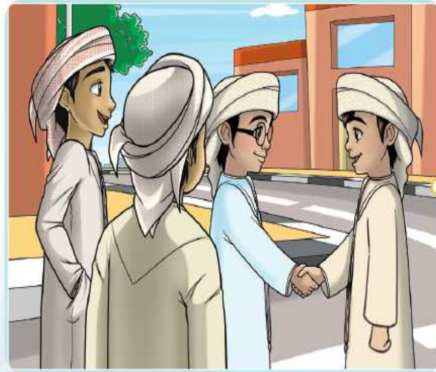
مَجْمُوعَةٌ مِنَ الْأَصْدِقَاءِ