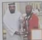
( ج ) الرياضة

ثانياً: حوط برسم دائرة حول الاختيار المناسب لكل عبارة مما يأتي: