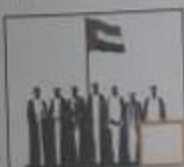
( د ) قيام الاتحاد