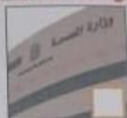
( أ ) الصحة