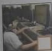
( ب ) التطعيم

أولاً: 10. ضع إشارة ( ✓ ) في المربع تحت الصورة التي توضح إنجازات صاحب السمو الشيخ خليفة بن زايد آل نهيان - حفظه الله: